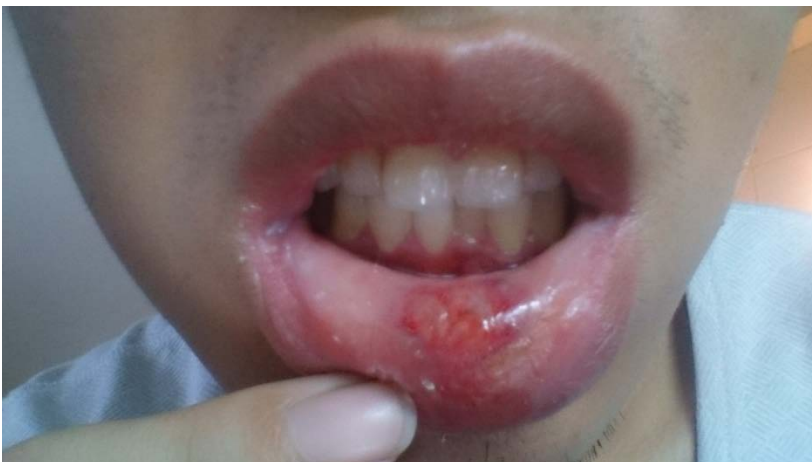
內嘴唇傷口照片(少一大塊皮)