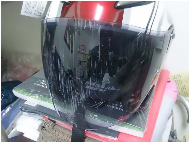
摔車時，面部著地 安全帽面罩受損照片